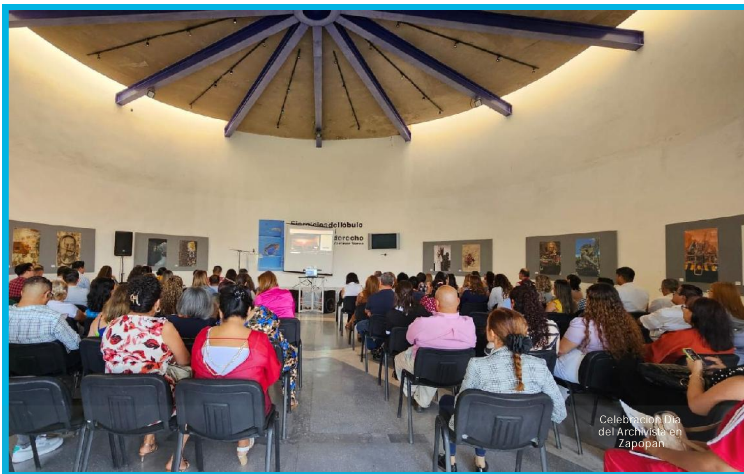
Celebración Día del Archivista en Zapopan

MANUAL DE ORGANIZACIÓN DE LA DIRECCIÓN DE PERMISOS Y LICENCIAS DE CONSTRUCCIÓN.