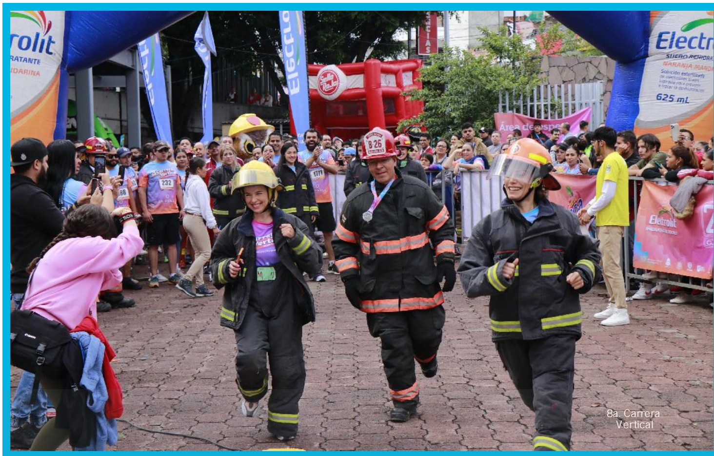
8a. Carrera Vertical

CONVOCATORIA PARA LA CONCESIÓN DE 3 LOCALES PARA LA PRESTACIÓN DE SERVICIOS PÚBLICOS DEL MERCADO "LOS VOLCANES" EN EL MUNICIPIO DE ZAPOPAN, JALISCO.