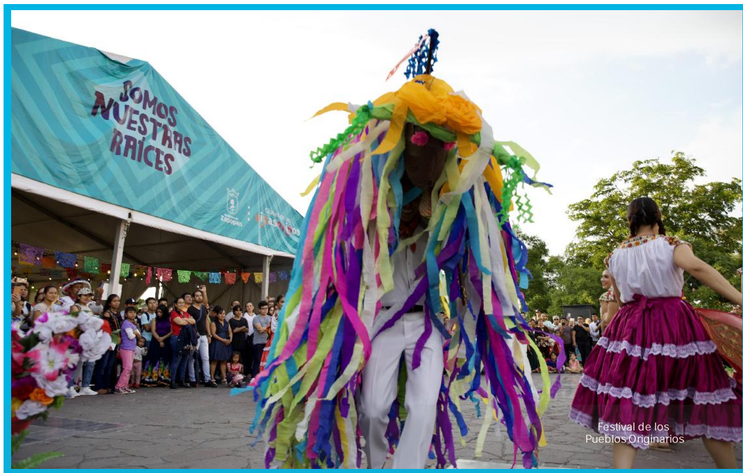
Festival de los Pueblos Originarios

MANUAL DE ORGANIZACIÓN DE LA CONTRALORÍA CIUDADANA.