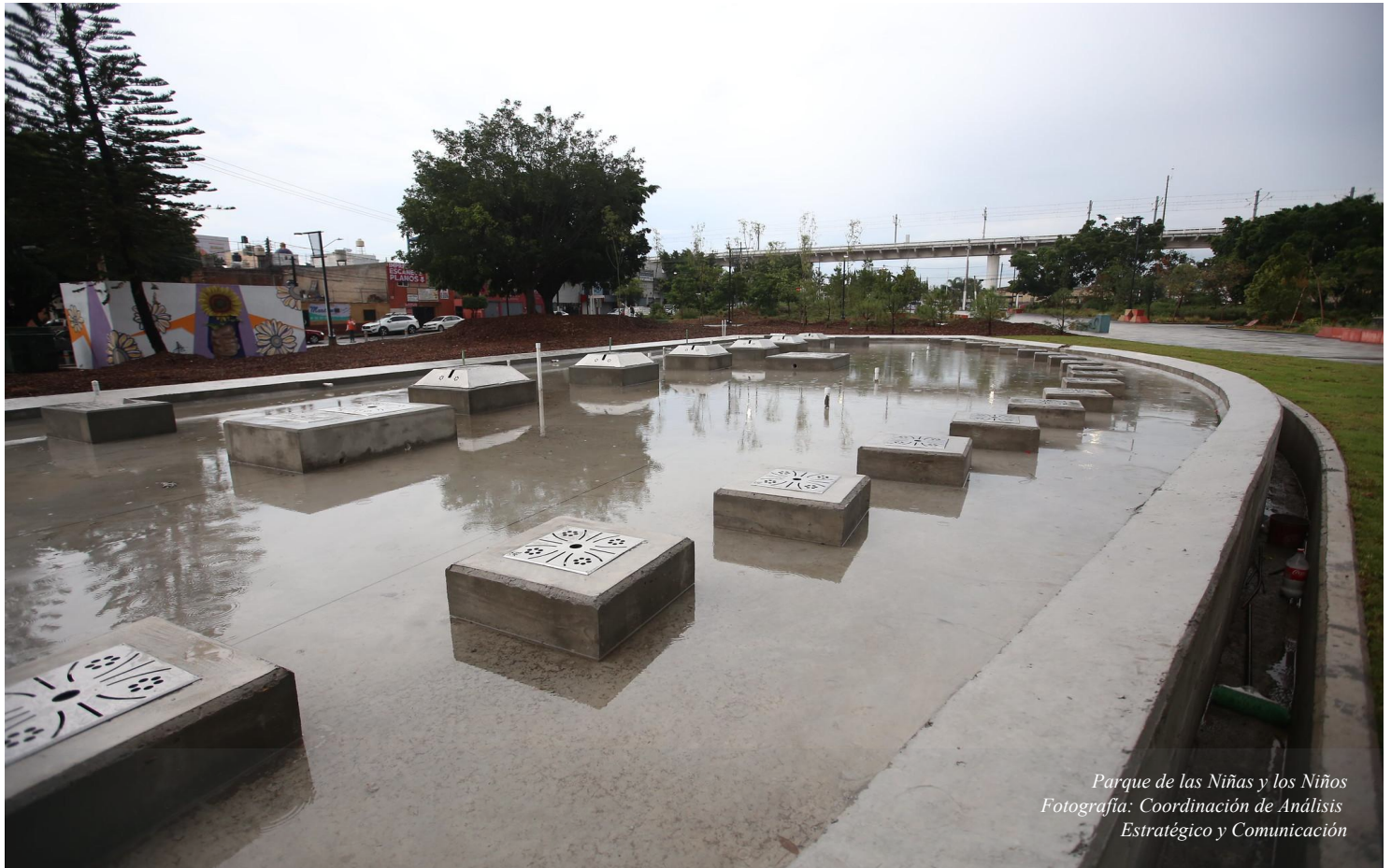
Parque de las Niñas y los Niños

NUEVO DOMICILIO DE LA OFICIALÍA DE PARTES DE LA SINDICATURA MUNICIPAL DEL AYUNTAMIENTO CONSTITUCIONAL DE ZAPOPAN, JALISCO.