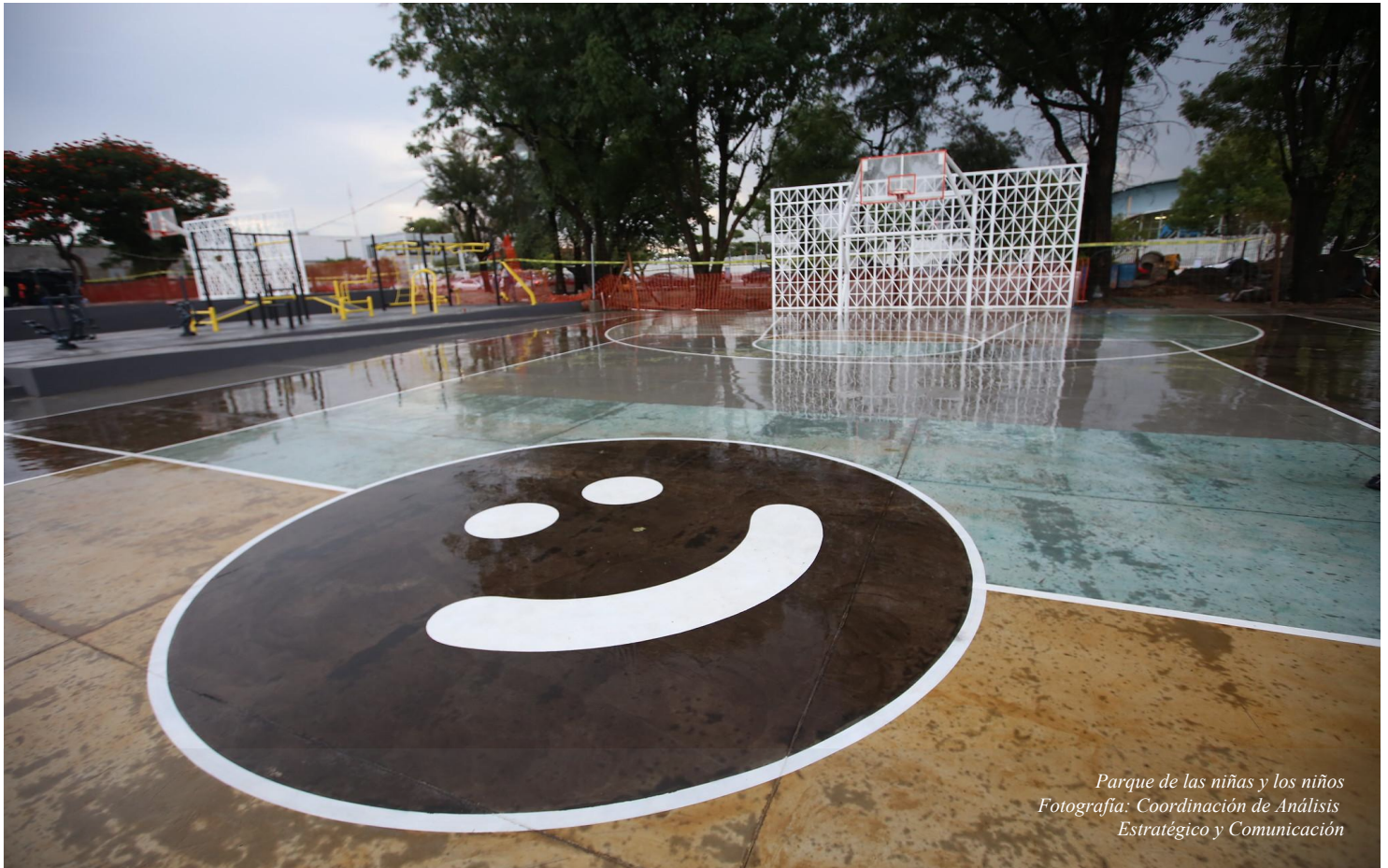
Parque de las niñas y los niños

ACUERDO DE DESIGNACIÓN DE FACULTADES COMO AUTORIDAD FISCAL EN LA TESORERÍA MUNICIPAL DE ZAPOPAN, JALISCO.