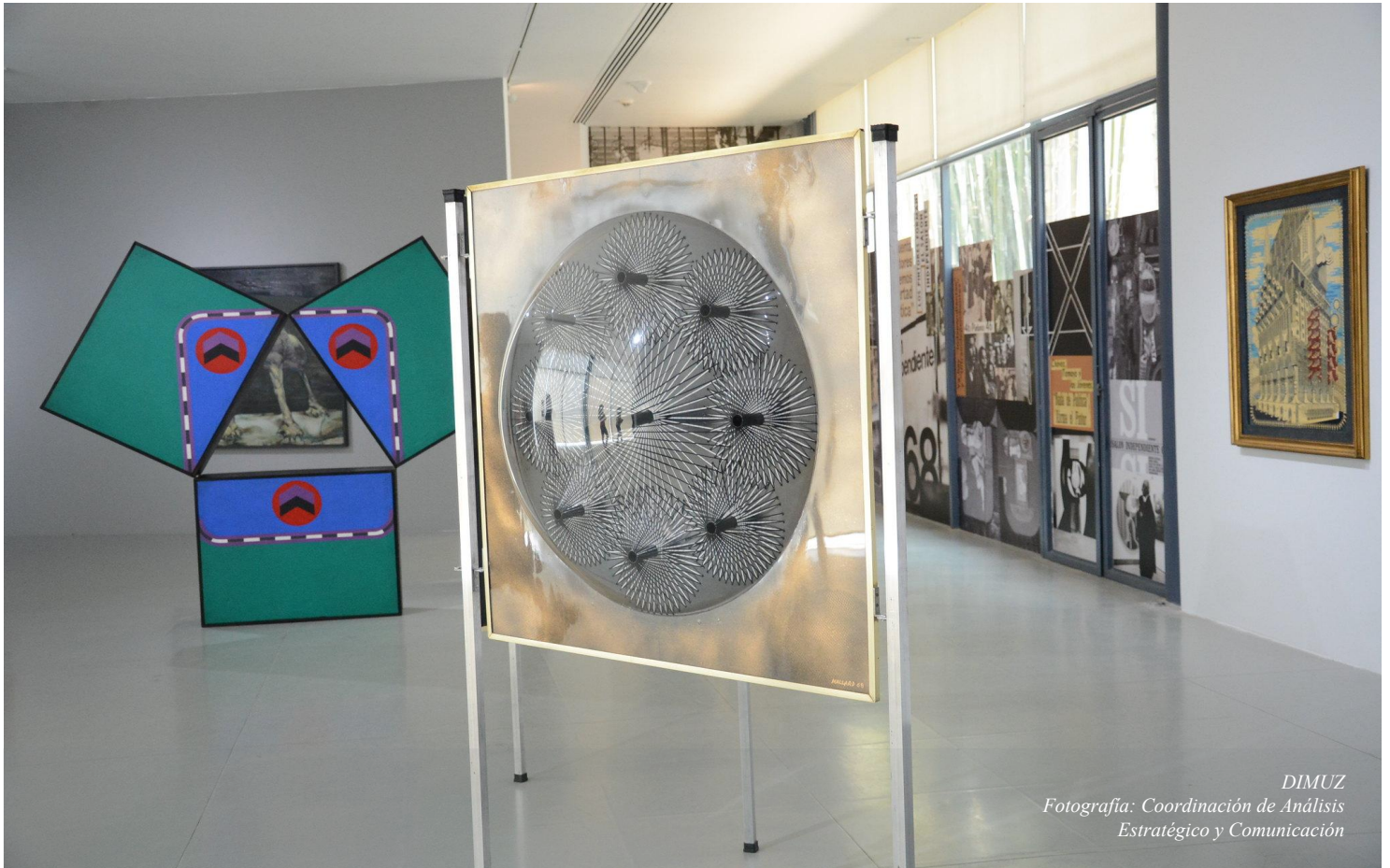
DIMUZ Fotografía: Coordinación de Análisis Estratégico y Comunicación

INCORPORACIÓN DE LOS BIENES MUEBLES DE 26 TABLETAS Y 6 TELÉFONOS CELULARES QUE FUERON DONADOS A LA DIRECCIÓN DE PROMOCIÓN ECONÓMICA DEL MUNICIPIO, POR LA EMPRESA HUAWEI MÉXICO.