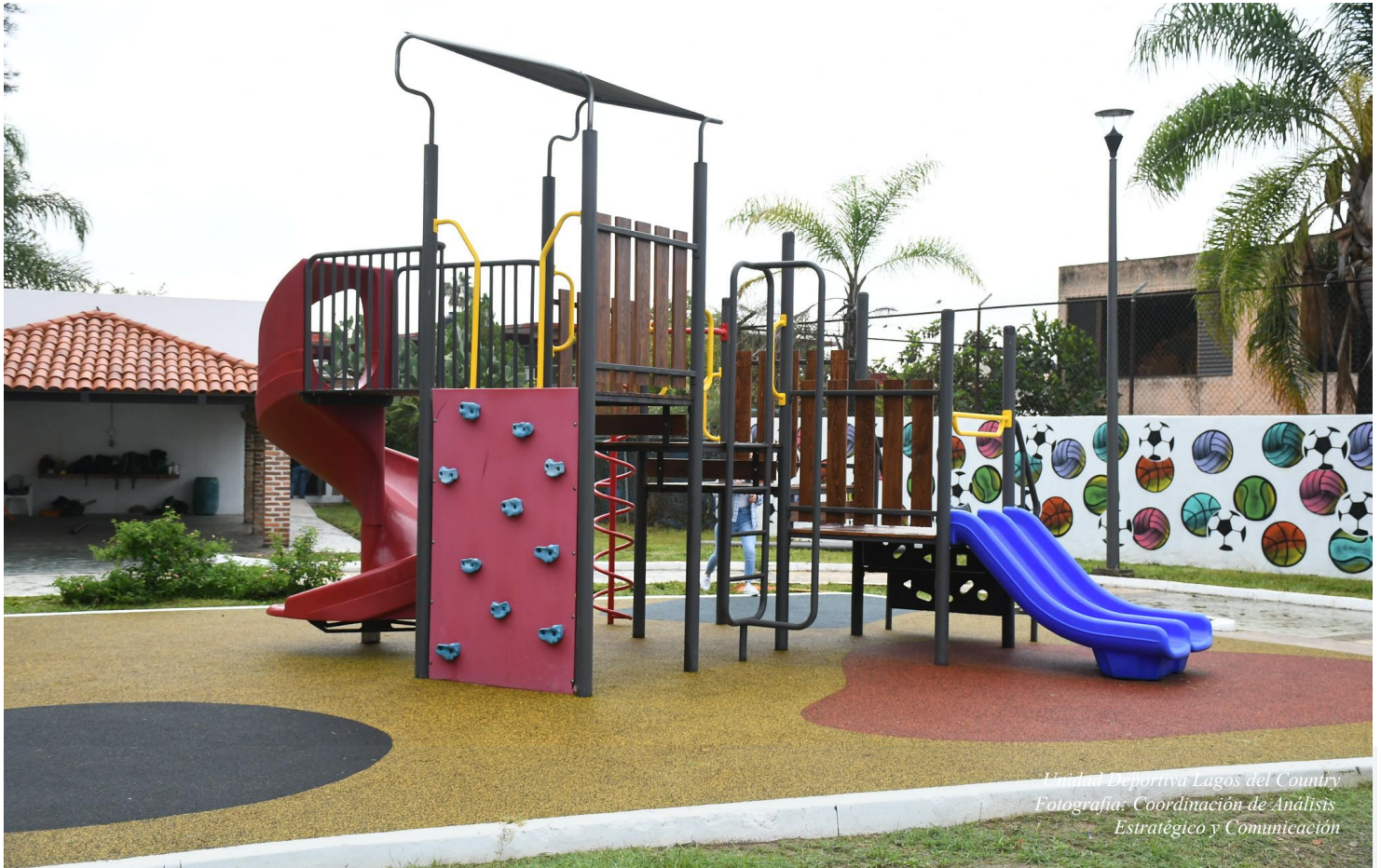
Unidad Deportiva Lagos del Country

ACUERDO DELEGATORIO DE LA SECRETARÍA DEL AYUNTAMIENTO DE ZAPOPAN, JALISCO.