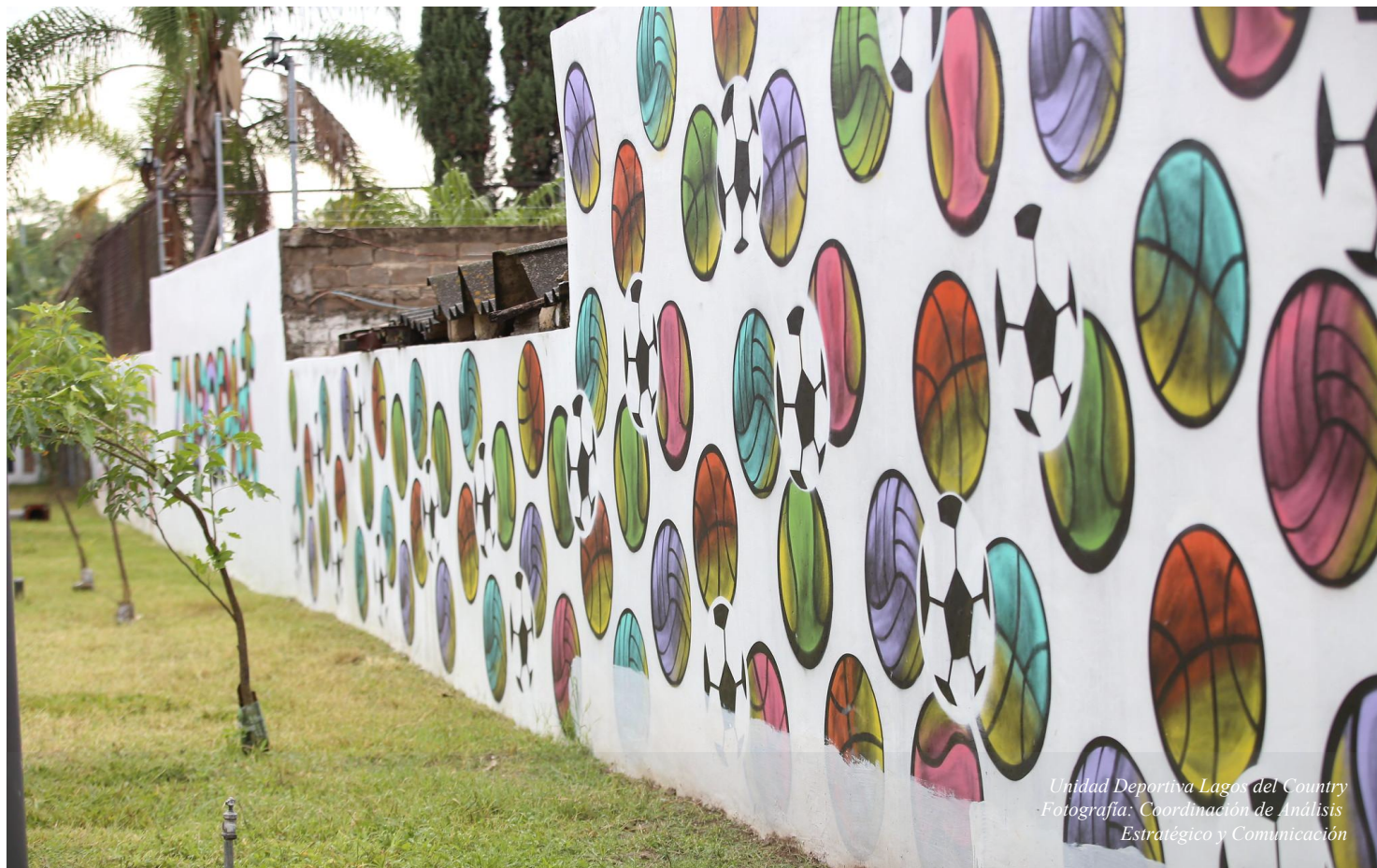
Unidad Deportiva Lagos del Country

SEGUNDA CONVOCATORIA PARA LA DESIGNACIÓN DE DIEZ PERSONAS CONSEJERAS QUIENES REPRESENTAN A LA SOCIEDAD CIVIL EN EL CONSEJO CIUDADANO DE CONTROL DEL MUNICIPIO DE ZAPOPAN, JALISCO.