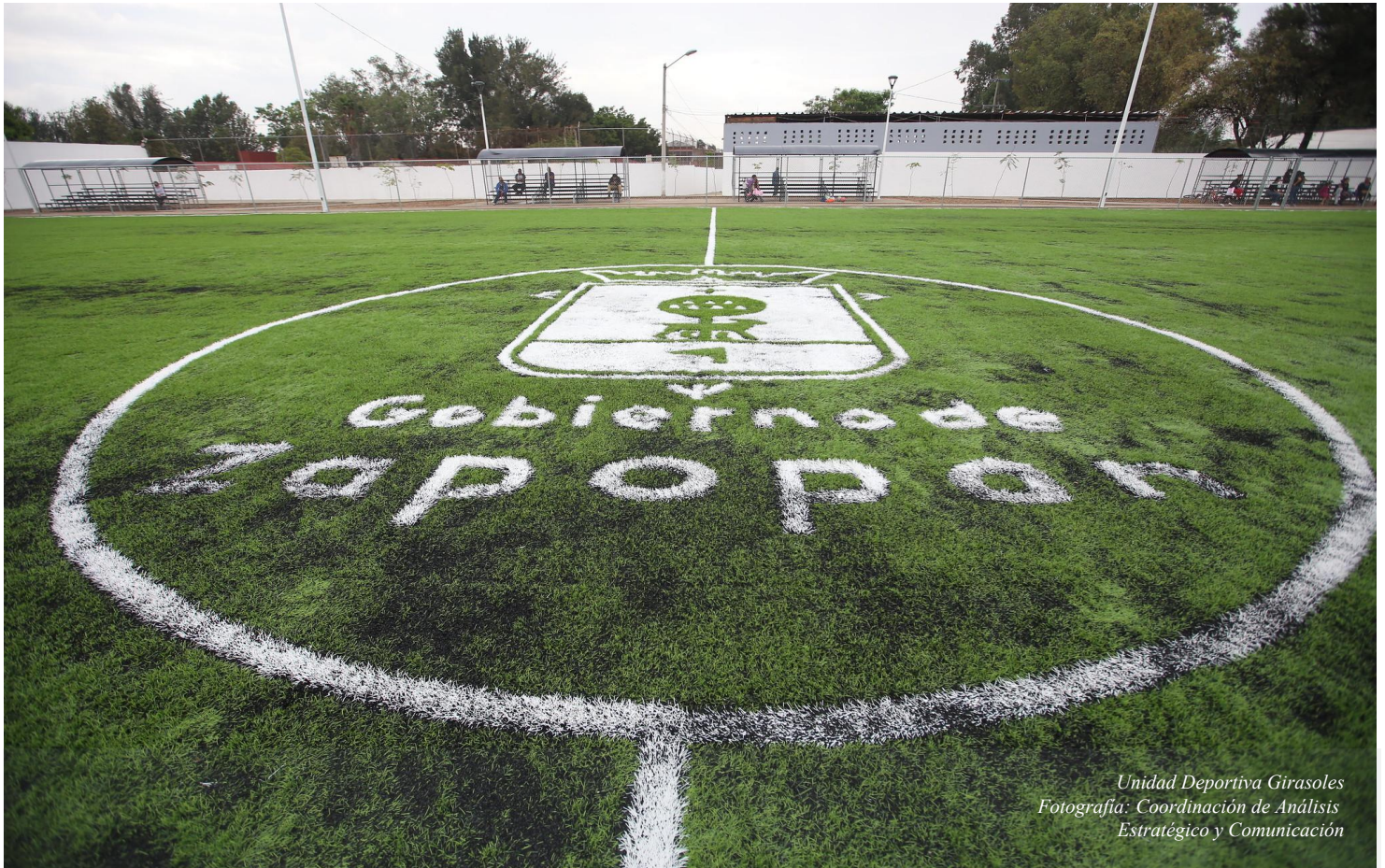
Unidad Deportiva Girasoles

ADICIÓN DE UNA FRACCIÓN XI AL ARTÍCULO 3º Y SE REFORMA EL ARTÍCULO 49 EN SUS FRACCIONES II, IV, Y SE ADICIONAN LAS FRACCIONES VIA LA VIII, ADEMÁS DE AGREGAR EL ANEXO ZONA A, DE LAS ESTACIONES DE LA LÍNEA 3 DEL TREN LIGERO Y DEL CENTRO INTEGRAL DE SERVICIOS ZAPOPAN (CISZ), PARA LA APLICACIÓN DE ESTAS DISPOSICIONES EN EL REGLAMENTO DE TIANGUIS Y COMERCIO EN ESPACIOS PÚBLICOS DEL MUNICIPIO DE ZAPOPAN, JALISCO.