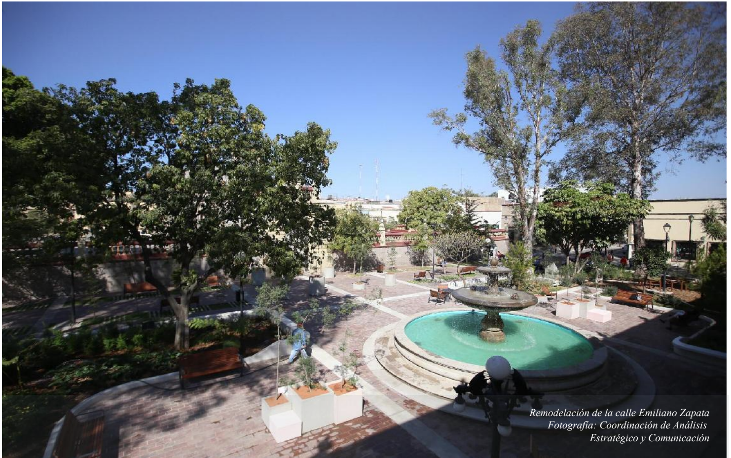
Remodelación de la calle Emiliano Zapata

AMPLIACIÓN A LA CONVOCATORIA DEL PROGRAMA "PADRE CUÉLLAR" EN EL MUNICIPIO DE ZAPOPAN, JALISCO.