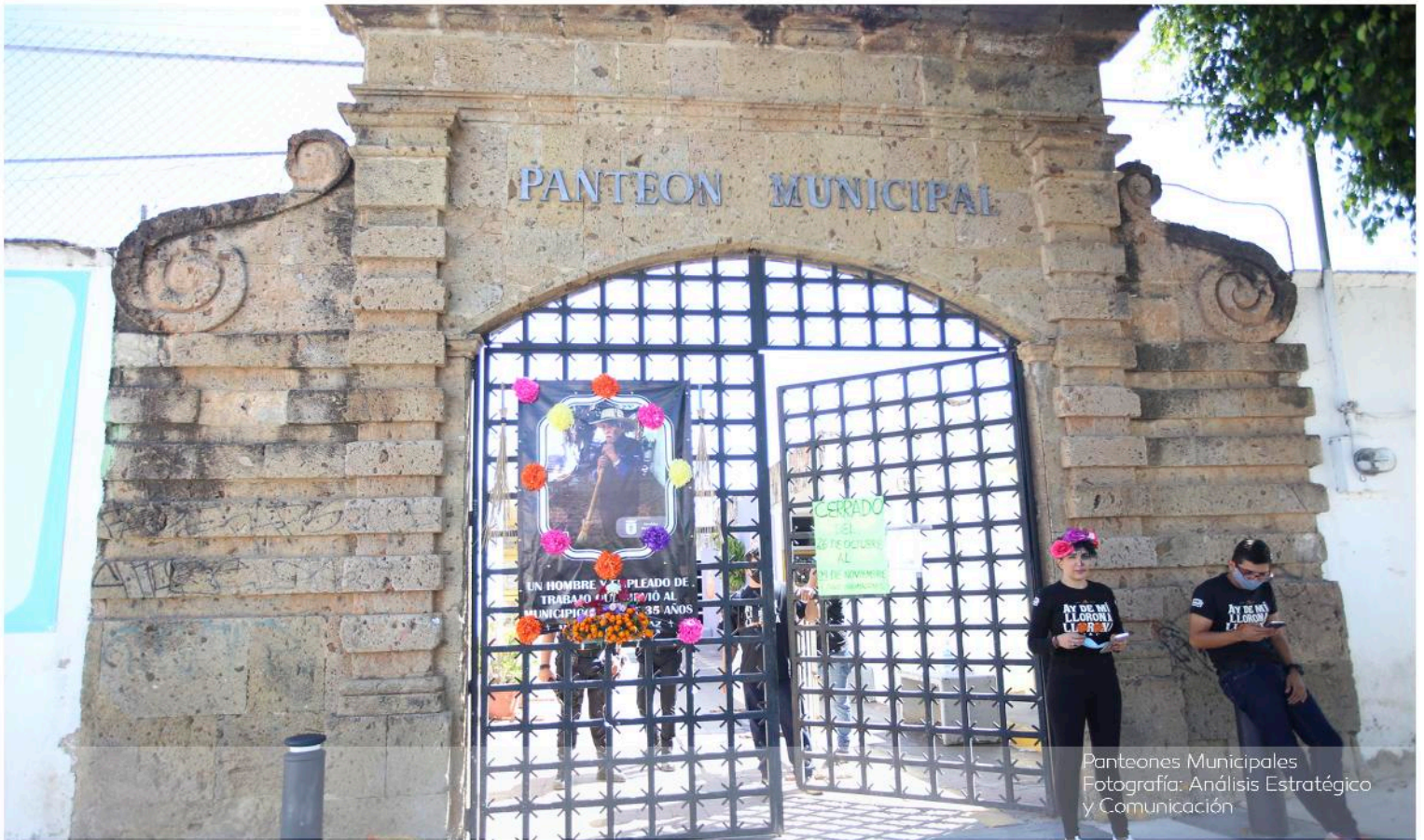
Panteones Municipales Fotografía: Análisis Estratégico y Comunicación

ACUERDO DE SUPLENCIA POR AUSENCIA DE LA TESORERÍA MUNICIPAL DEL MUNICIPIO DE ZAPOPAN, JALISCO. EMITIDO EL 30 DE OCTUBRE DE 2020.