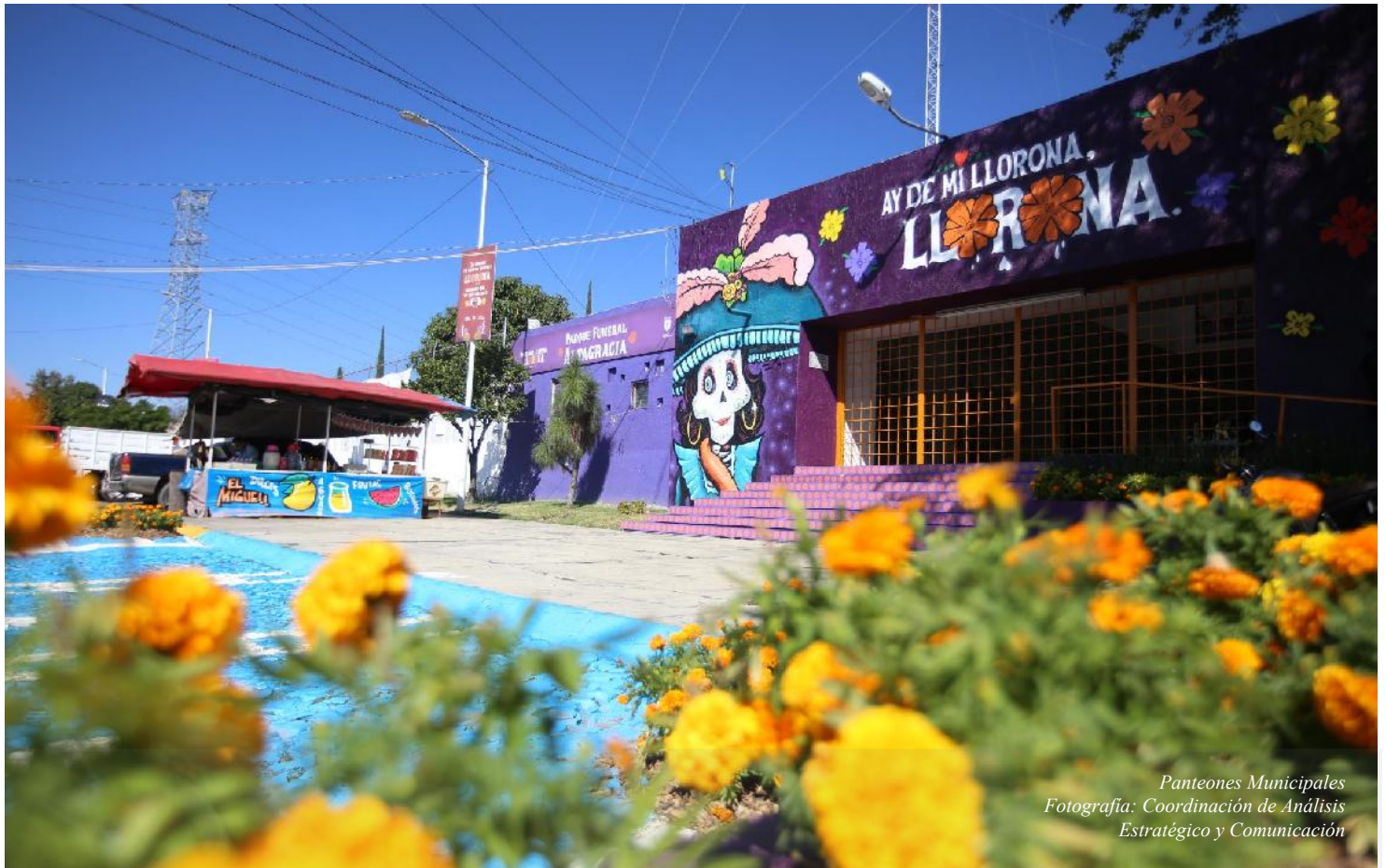
Panteones Municipales

TERMINACIÓN ANTICIPADA DEL CONTRATO DE COMODATO CO-310/2005-B CELEBRADO CON ESTE MUNICIPIO, RESPECTO DE UN INMUEBLE DE LA COLONIA EL CAMPANARIO, ASÍ COMO LA INCORPORACIÓN DEL BIEN AL DOMINIO PÚBLICO MUNICIPAL DE ZAPOPAN, JALISCO.