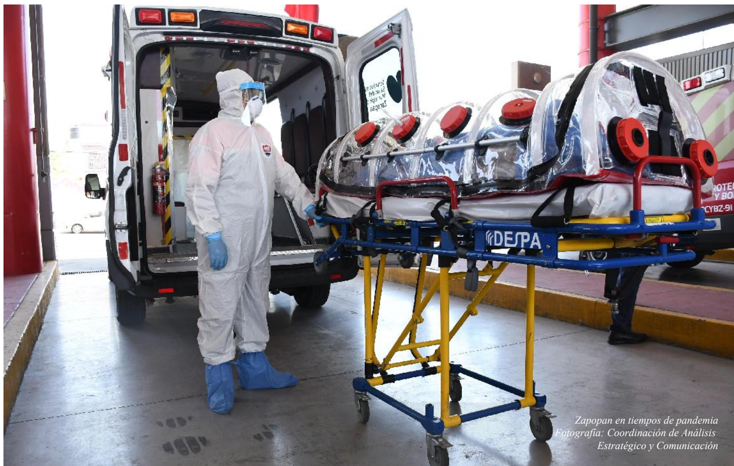
Zapopan en tiempos de pandemia

FE DE ERRATAS DE LA GACETA VOL. XXVII NO. 14 DE 6 DE MARZO DE 2020. DE LAS REGLAS DE OPERACIÓN DEL PROGRAMA SOCIAL "ZAPOPAN ¡PRESENTE!".