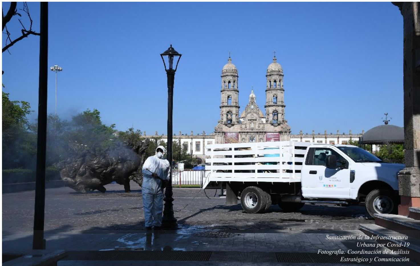
Sanitización de la Infraestructura Urbana por Covid-19

REGLAS DE OPERACIÓN DEL PROGRAMA SOCIAL "DEJA TU HUELLA 2020".