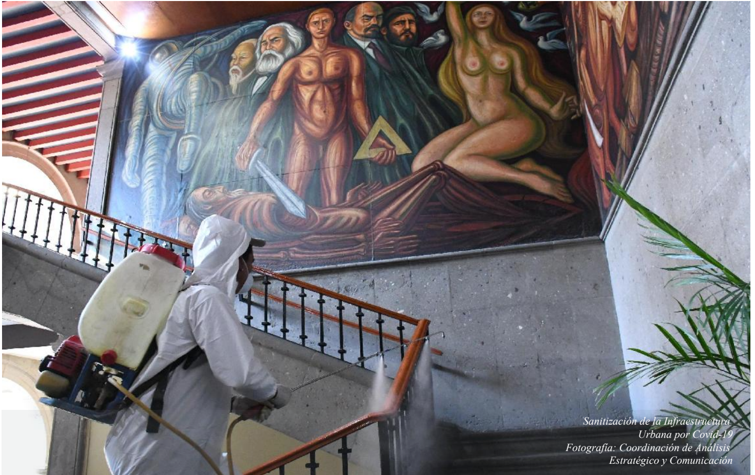
Sanitización de la Infraestructura Urbana por Covid-19

REGLAS DE OPERACIÓN DEL PROGRAMA SOCIAL "CENTROS DE ATENCIÓN INFANTIL CERTIFICADOS".