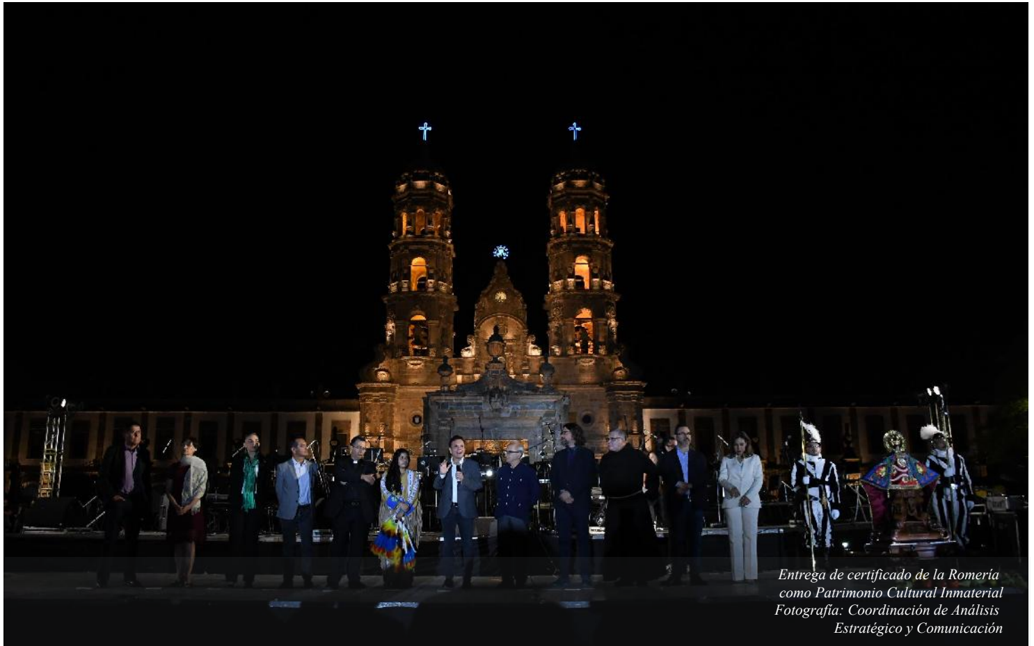
Entrega de certificado de la Romería como Patrimonio Cultural Inmaterial

REGULARIZACIÓN DEL PREDIO IRREGULAR "ITURBIDE 97, SANTA ANA TEPETILÁN" EN EL MUNICIPIO DE ZAPOPAN, JALISCO.