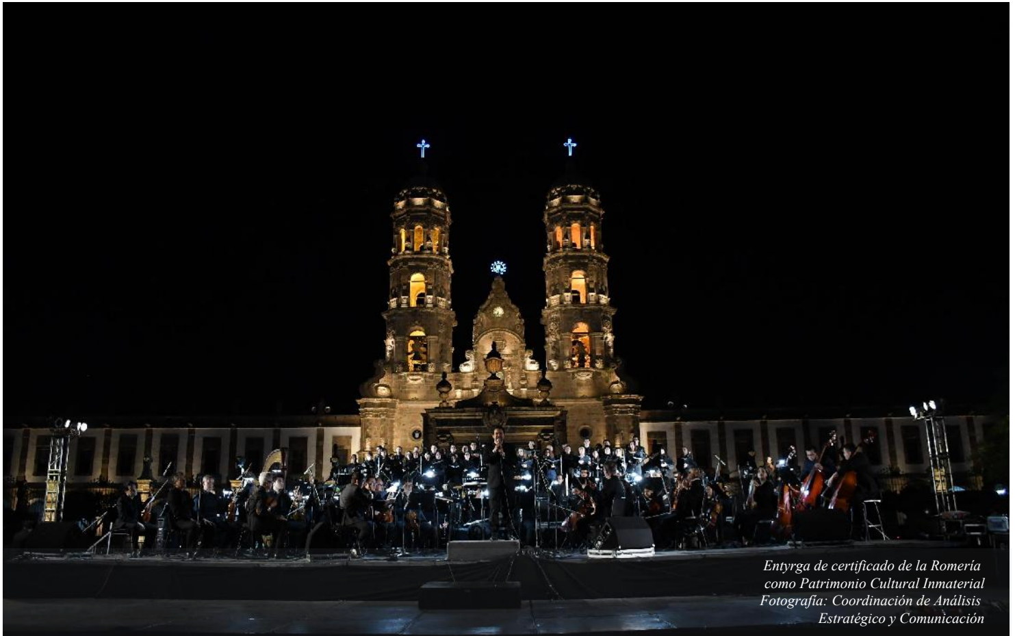
Entyrga de certificado de la Romería como Patrimonio Cultural Inmaterial

REGULARIZACIÓN DEL PREDIO IRREGULAR "PRIVADA CANTERA MORADA 5" EN EL MUNICIPIO DE ZAPOPAN, JALISCO.