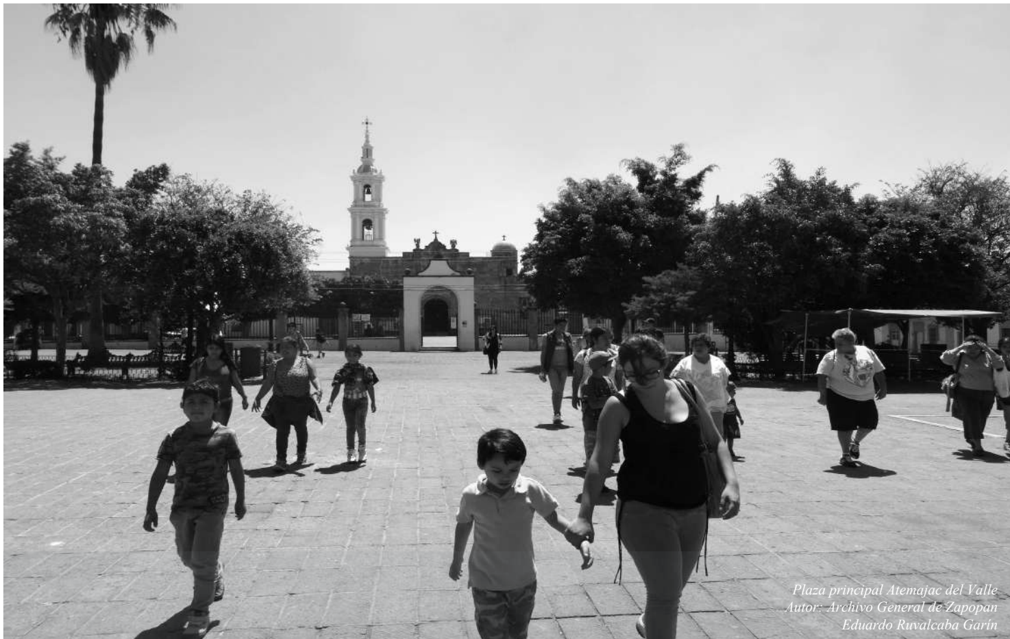
Plaza principal Atemajac del Valle

CONVOCATORIA PÚBLICA Y ABIERTA PARA ESTANCIAS INFANTILES PRIVADAS Y DE SEDESOL, PARA QUE PARTICIPEN EN EL PROGRAMA DE BECAS SONRÍE ZAPOPAN.