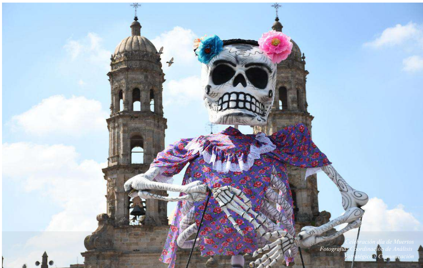
Celebración día de Muertos

ACUERDO DELEGATORIO DE LA SINDICATURA DEL MUNICIPIO DE ZAPOPAN, JALISCO.