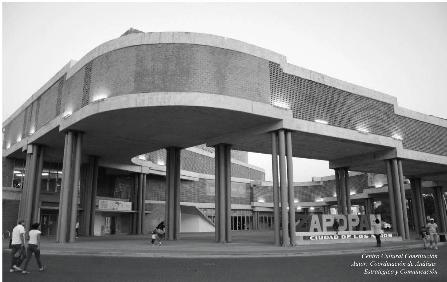
Centro Cultural Constitución Autor: Coordinación de Análisis Estratégico y Comunicación

REGLAS DE OPERACIÓN DEL PROGRAMA "ZAPOPAN POR ELLAS" PARA EL EJERCICIO FISCAL 2018.