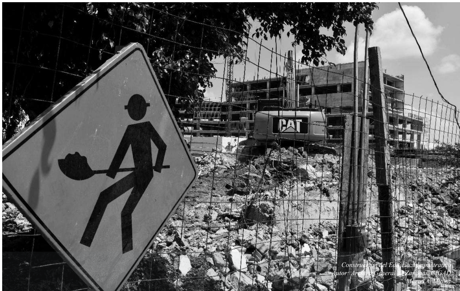
Construcción del Edificio Administrativo Autor: Archivo General de Zapopan (GAD) Mónica A. Muñoz

SE DECLARA FORMALMENTE REGULARIZADO EL ESPACIO PÚBLICO "DELEGACIÓN DE ATEMAJAC Y PLAZOLETA" EN EL MUNICIPIO DE ZAPOPAN, JALISCO.