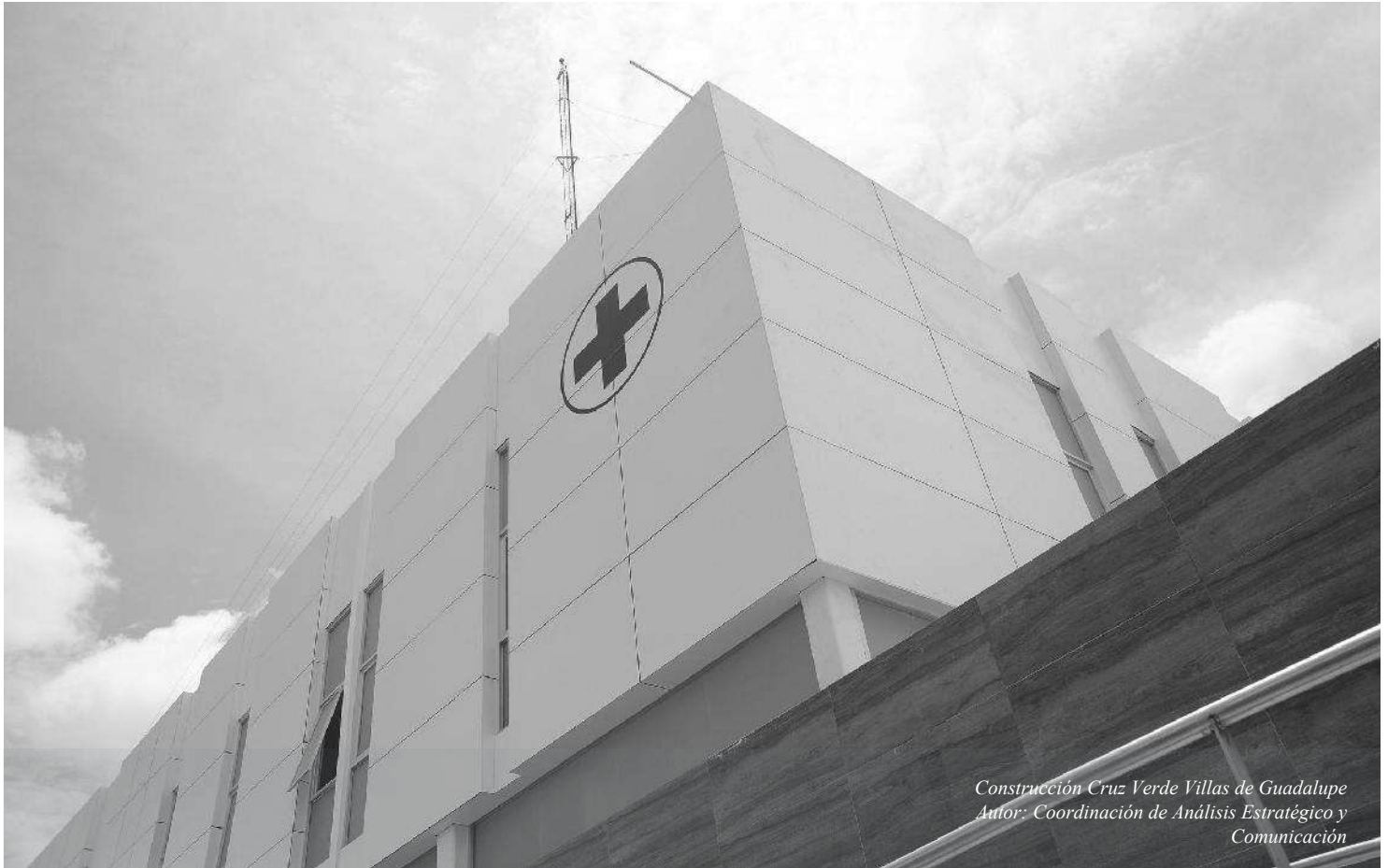
Construcción Cruz Verde Villas de Guadalupe

SELECCIÓN DE LOS DOS CONSEJEROS TITULARES Y DE DOS CONSEJEROS SUPLENTE PARA QUE INTEGREN EL CONSEJO CIUDADANO METROPOLITANO QUE REPRESENTEN AL MUNICIPIO DE ZAPOPAN, JALISCO.