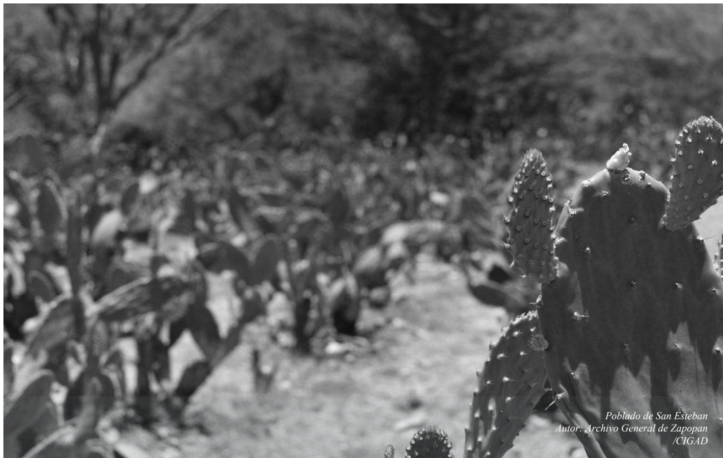
Poblado de San Esteban

ANEXO TÉCNICO DE TRANSPARENCIA PRESUPUESTARIA AL PRESUPUESTO DE EGRESOS DEL MUNICIPIO DE ZAPOPAN, JALISCO. PARA EL EJERCICIO FISCAL 2018.