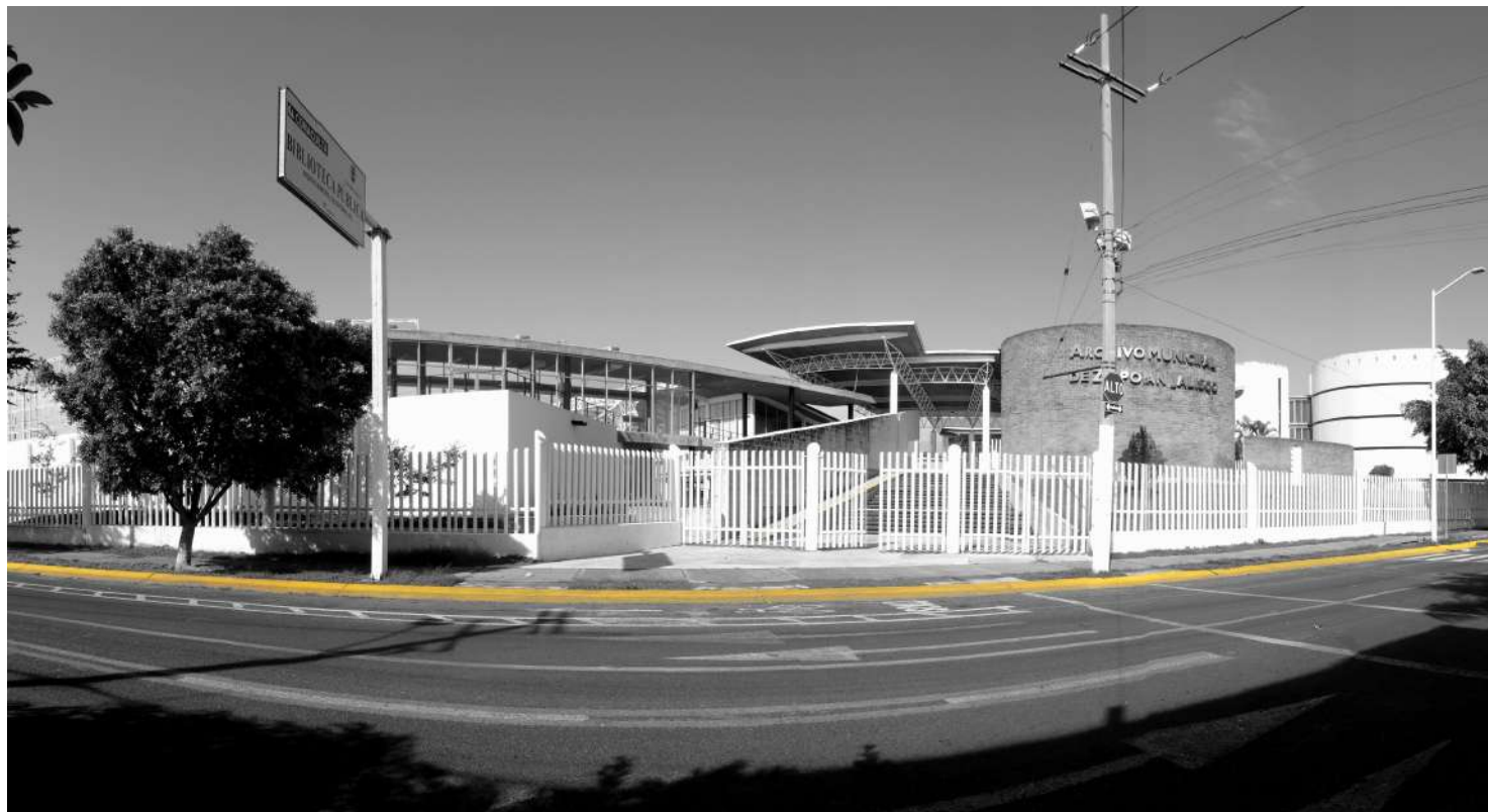
Archivo General de Zapopan Autor: Archivo General de Zapopan/CIGAD Marco A. Muñoz

CONVENIO ESPECÍFICO DE ADHESIÓN AL FORTASEG 2018 DEL MUNICIPIO DE ZAPOPAN, JALISCO.