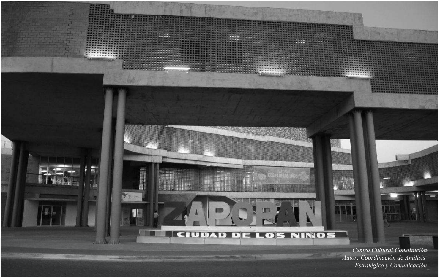
Centro Cultural Constitución

REGLAS DE OPERACIÓN DEL PROGRAMA "SONRÍE ZAPOPAN" PARA EL EJERCICIO FISCAL 2018.