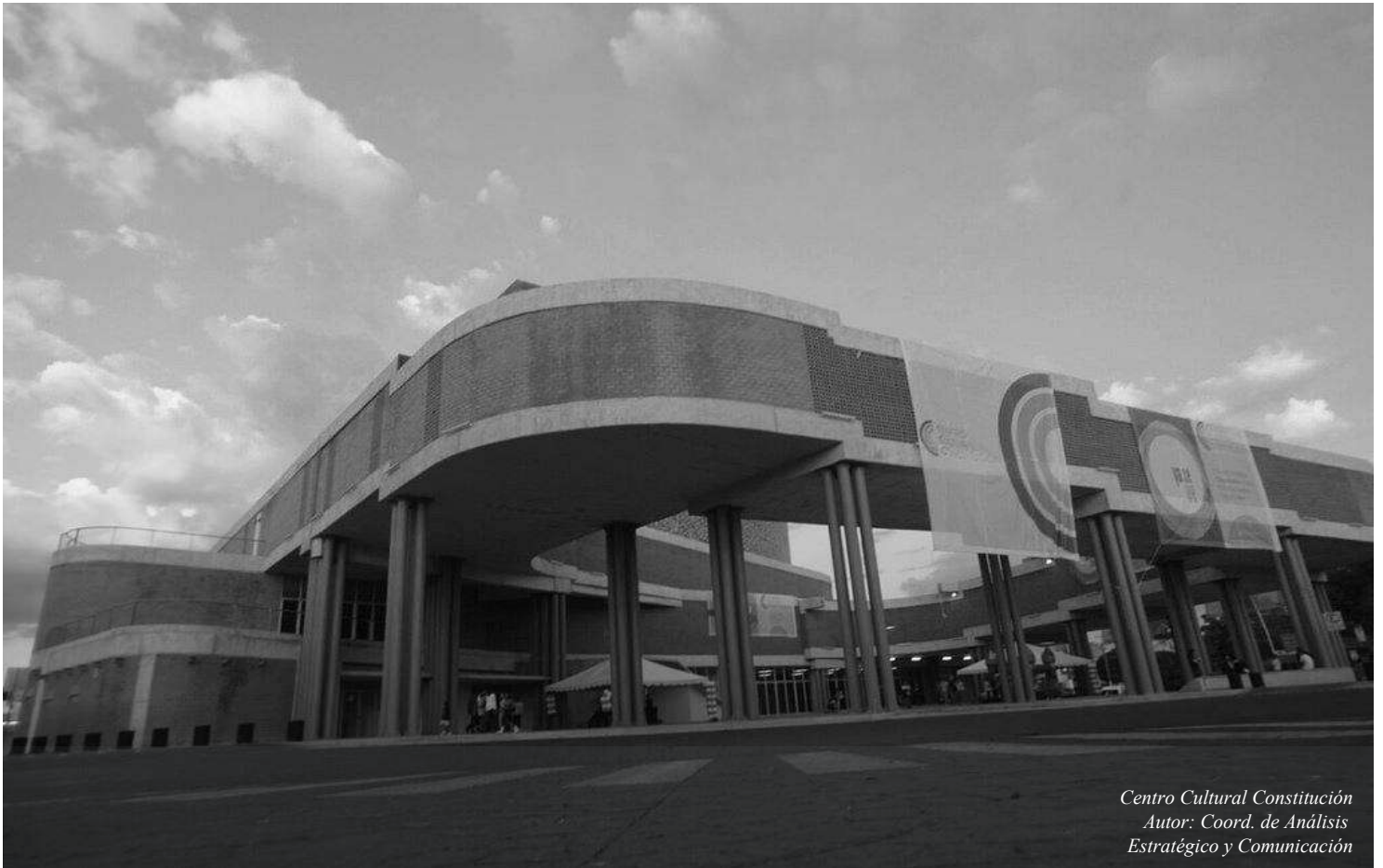
Centro Cultural Constitución Autor: Coord. de Análisis Estratégico y Comunicación

MODIFICACIONES A LAS REGLAS DE OPERACIÓN DEL PROGRAMA "SONRÍE ZAPOPAN" Y SUS ANEXOS.