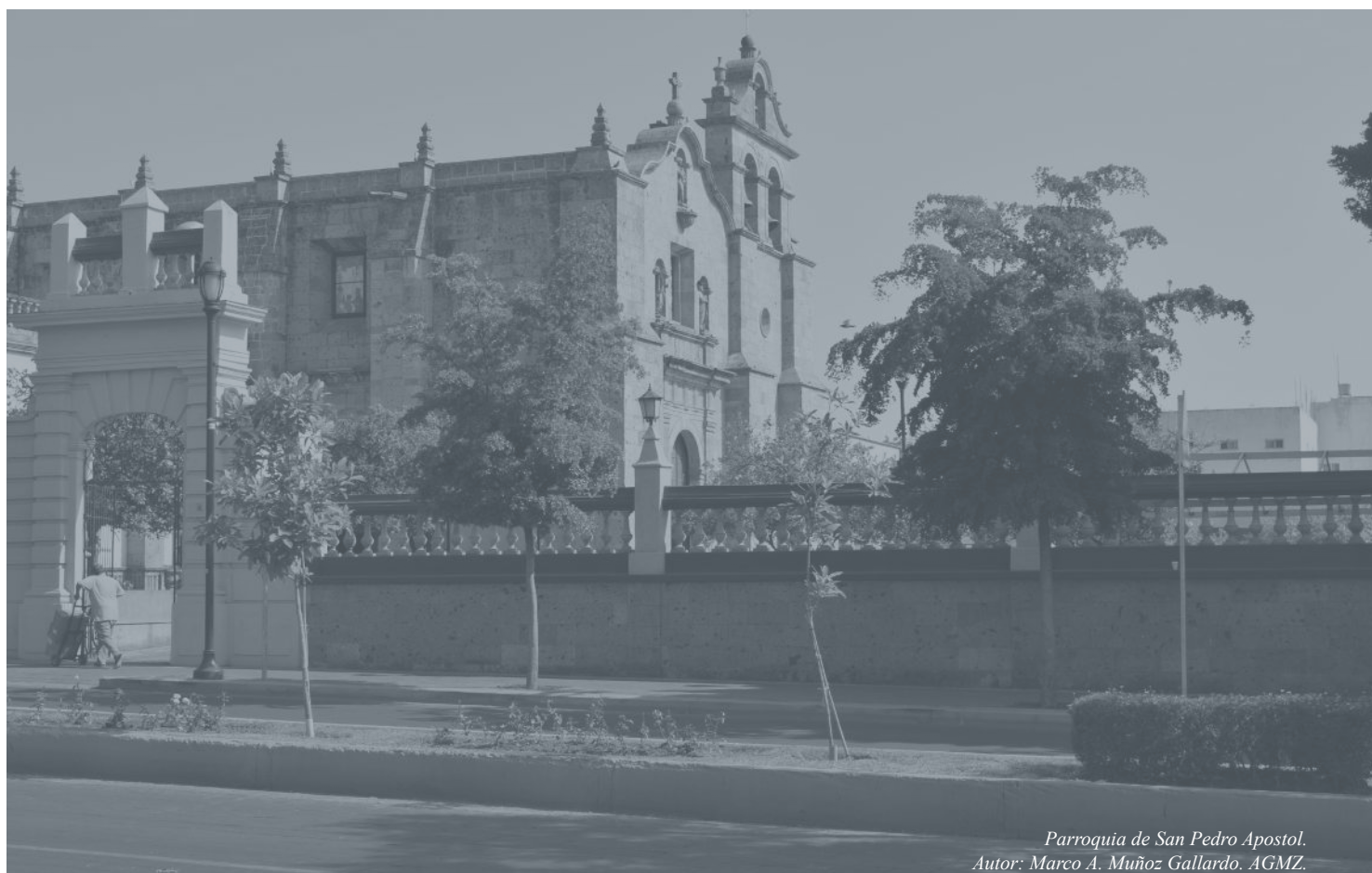
Parroquia de San Pedro Apostol.

PRESUPUESTO DE EGRESOS PARA EL EJERCICIO FISCAL 2016, EN EL MUNICIPIO DE ZAPOPAN, JALISCO.