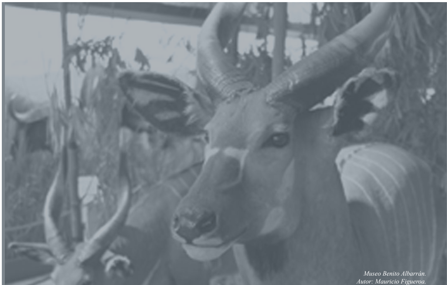
Museo Benito Albarrán. Autor: Mauricio Figueroa.

REGLAS DE OPERACIÓN DEL PROGRAMA "ZAPOPAN ¡PRESENTE!".