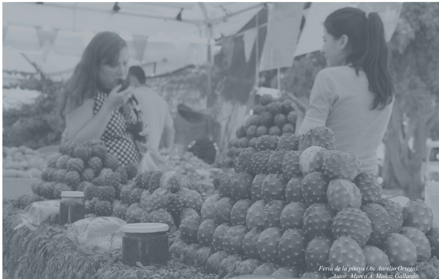
Feria de la pitaya (Av. Aurelio Ortega). Autor: Marco A. Muñoz Gallardo.

RESUMEN DE 71 EXPEDIENTES DE TITULACIÓN DE LOTES, UBICADOS EN EL MUNICIPIO DE ZAPOPAN, JALISCO.