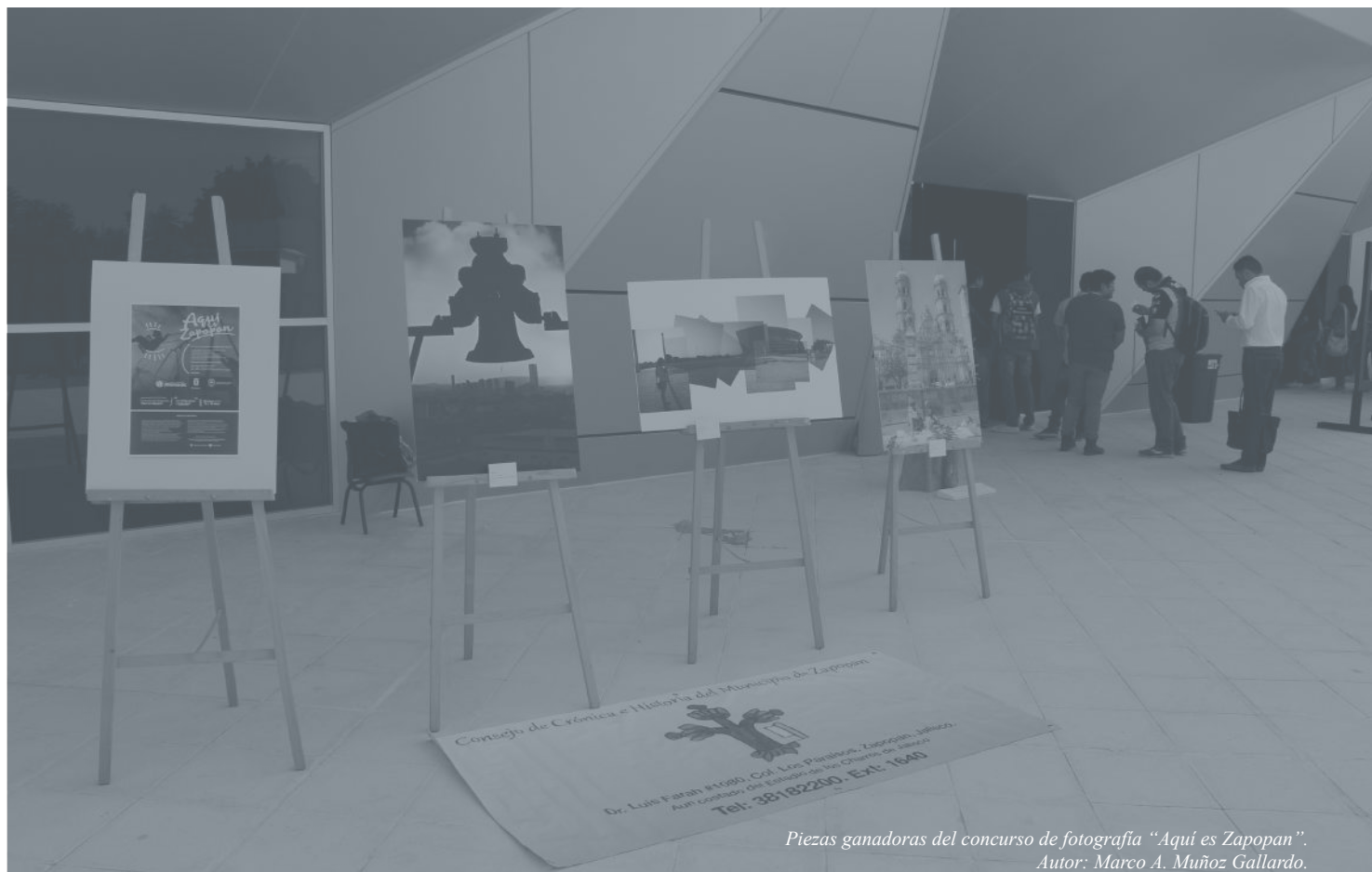
Piezas ganadoras del concurso de fotografía "Aquí es Zapopan". Autor: Marco A. Muñoz Gallardo.