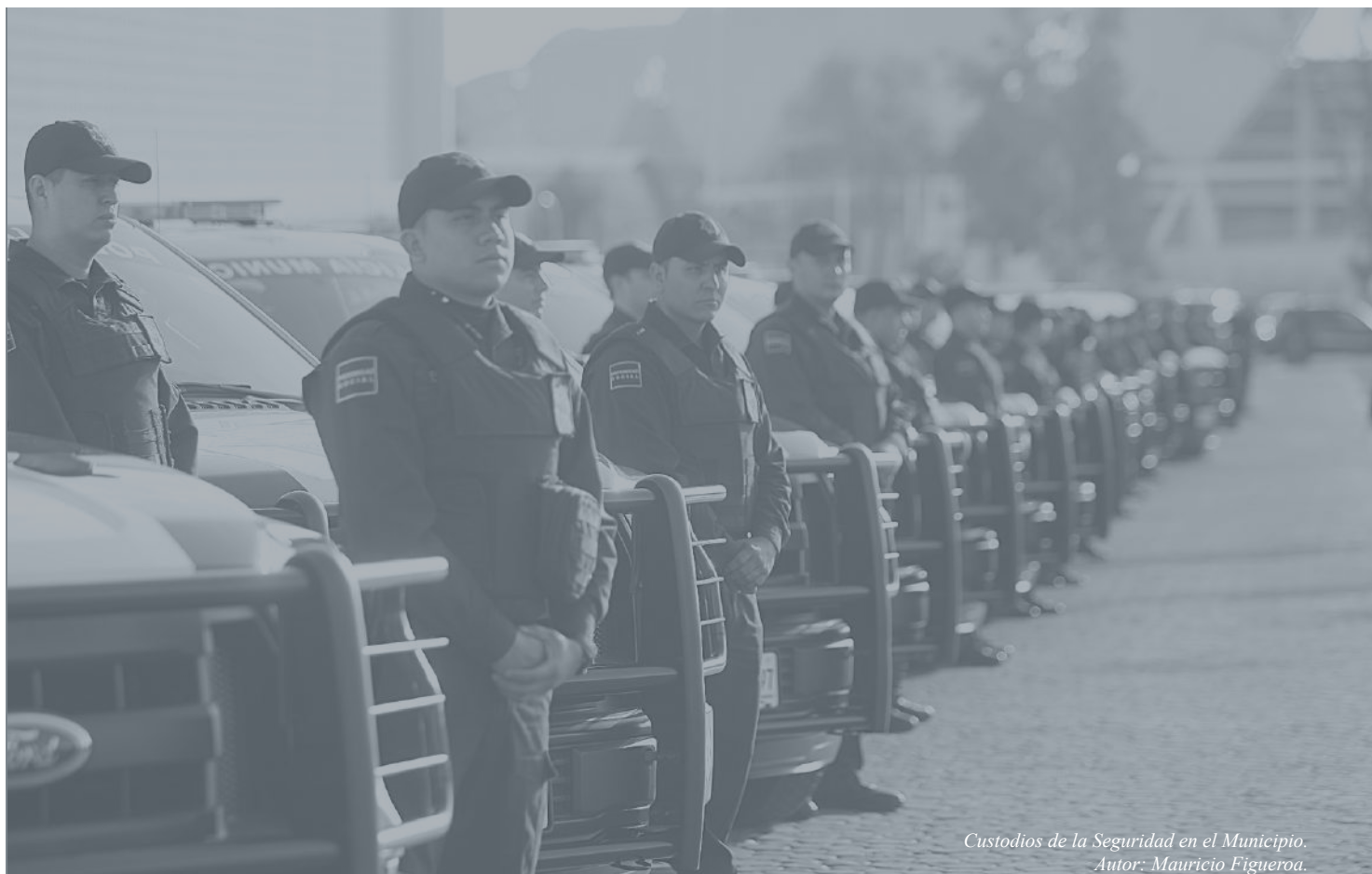
Custodios de la Seguridad en el Municipio. Autor: Mauricio Figueroa.