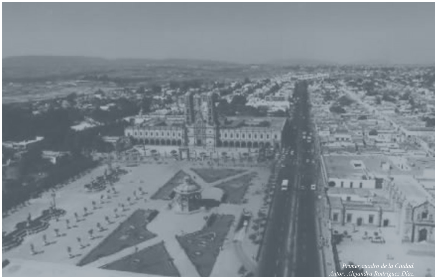
Primer cuadro de la Ciudad. Autor: Alejandra Rodríguez Díaz.

DECLARATORIA DE HITOS URBANOS DEL MUNICIPIO DE ZAPOPAN, JALISCO.