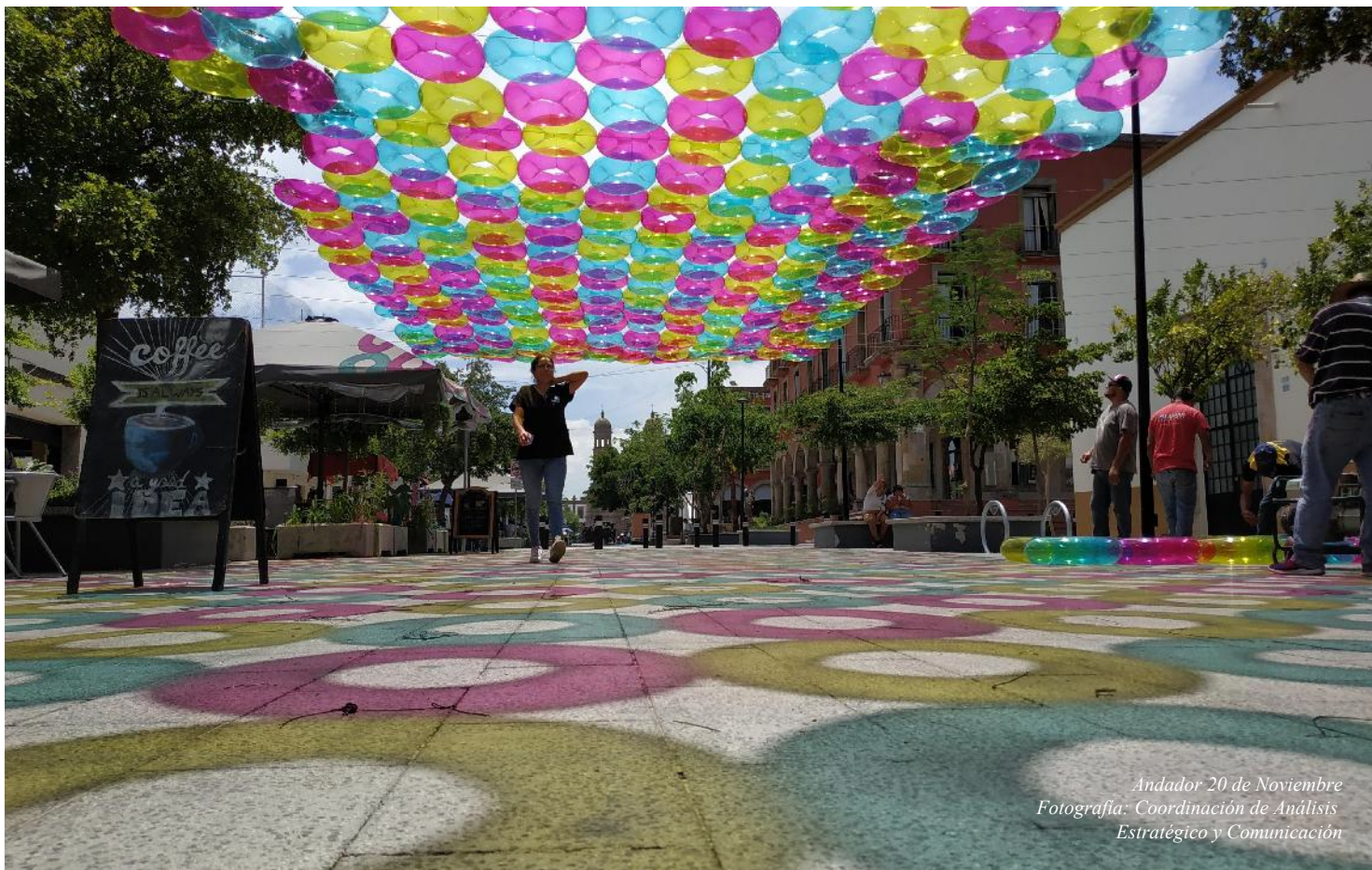
Andador 20 de Noviembre

CONVOCATORIA PARA LA ELECCIÓN DE LOS CIUDADANOS DEL CONSEJO DE PARTICIPACIÓN CIUDADANA Y POPULAR PARA LA GOBERNANZA.